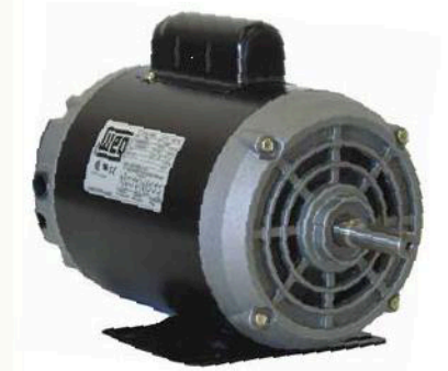
MOTOR ELECTRICO MONOFASICO PARA TODA APLICACION ABIERTO , 220/110 VOLT.