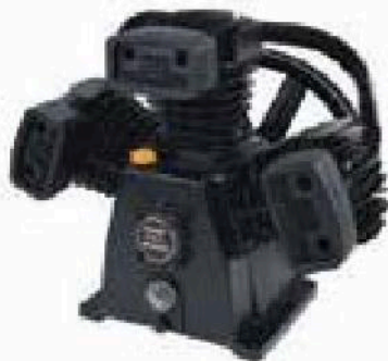
CABEZAL 100% FIERRO FUNDIDO, DOS CILINDROS EN "W", CON VISOR PARA EL NIVEL DE ACEITE .